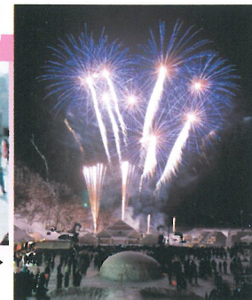
利賀そば祭り の花火

行程 金沢駅 (13:30) - 香林坊 (13:45) - 相倉合掌造り集落 (現地ガイドの案内有り) ... - 南砺利賀そば祭り (自由散策) - 金沢駅 (21:30) - 香林坊 (21:45)