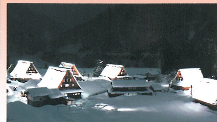
▲菅沼合掌造り集落ライトアップ

行程 香林坊 (17:30) - 金沢駅 (17:50) - 合掌の里臨時駐車場 ... 菅沼合掌造り集落 (自由散策) ... 駐車場 - 金沢駅 (21:30) - 香林坊 (21:50)